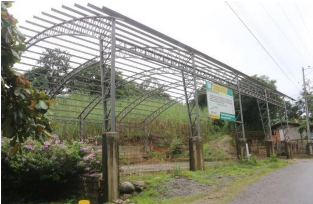
Ilustración 8.. Contratación de la cubierta Nueva Unión - MONTO = $ 52.077,48