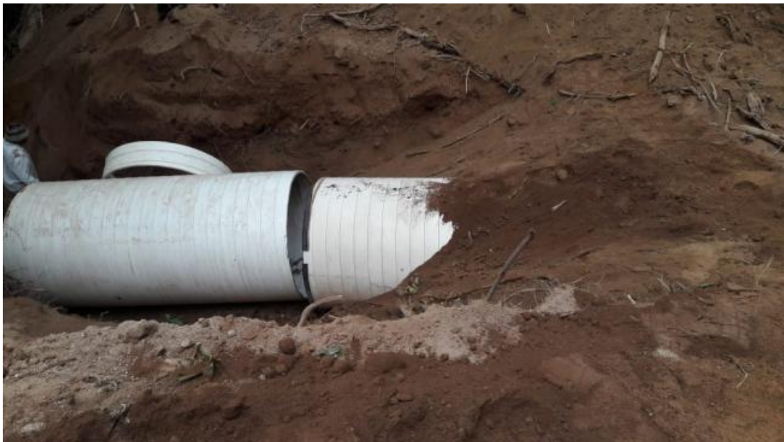
Ilustración 4. Convenio Con Gobierno Autónomo Descentralizado Parroquial de Salati Apertura de Vía / Monto : $ 11.500