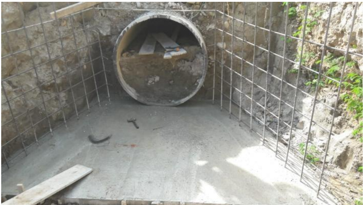
Ilustración 6. Construcción de cabezales en la vía salado - El pindo / Monto: $7.000