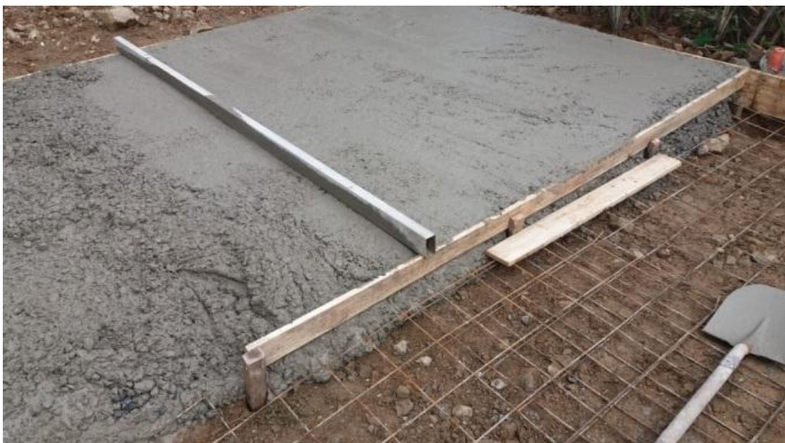
Ilustración 2. Pavimentación Barrio La Lima / Monto: $2.000