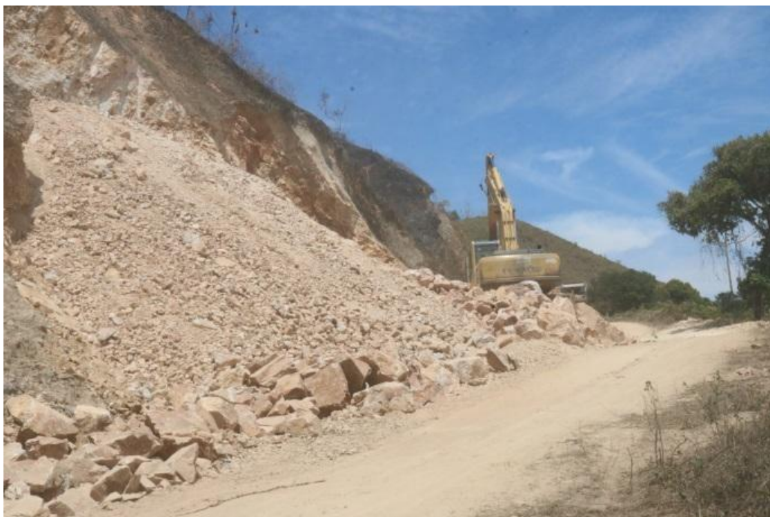
Ilustración 7. Se Realizo 2km de la vía tarapal - Vía Guayabo / Monto $ 10.200.