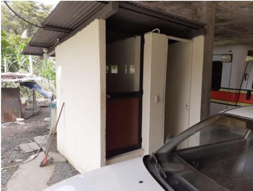
Ilustración 12 – Terminación de baterías sanitarias / Monto: 3.500.