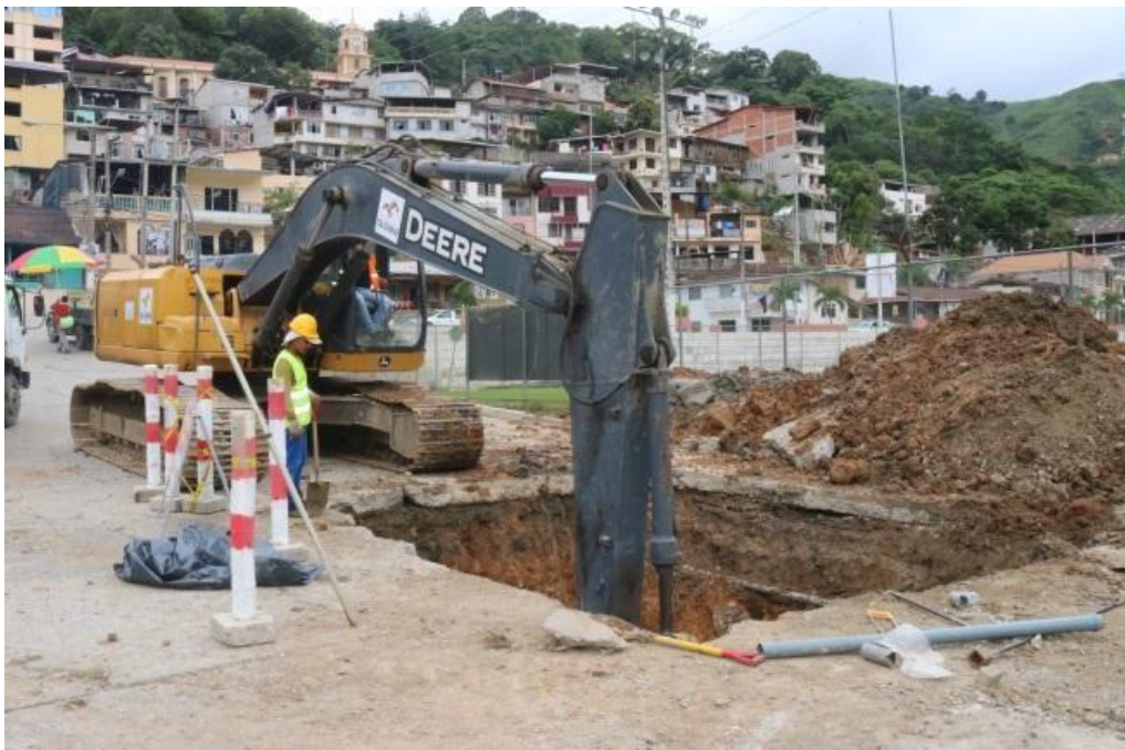
Ilustración 9 – Terminación de la 2da etapa del alcantarillado pluvial / Monto : $1'919.982,14