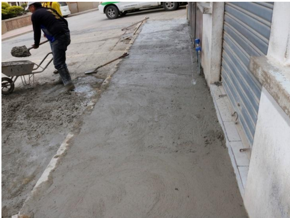
Ilustración 11 – Recuperación de aceras – Monto $2.500