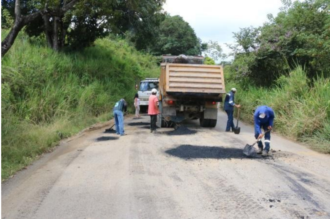
Ilustración 1. Bacheo puente unión portovelense barrio- Monto: $ 3.500