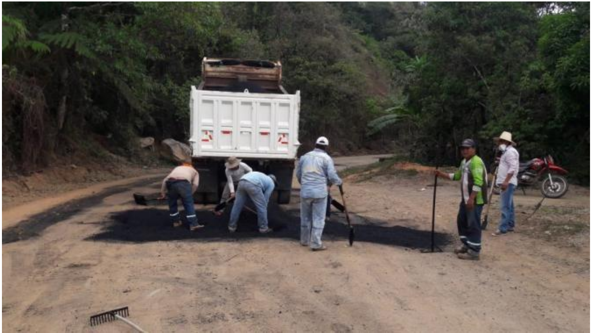
Ilustración 5. Convenio bacheo puente rio Luis - Morales / Monto: $ 2.500