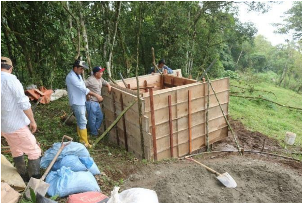
Ilustración 10 – Construcción de dos tanques para agua curtincapac / Monto : $7.000