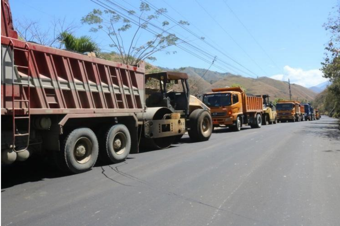
Ilustración 3. Asfaltado Puente negro - Puente el Pindo CONVENIO - Monto: $115.00